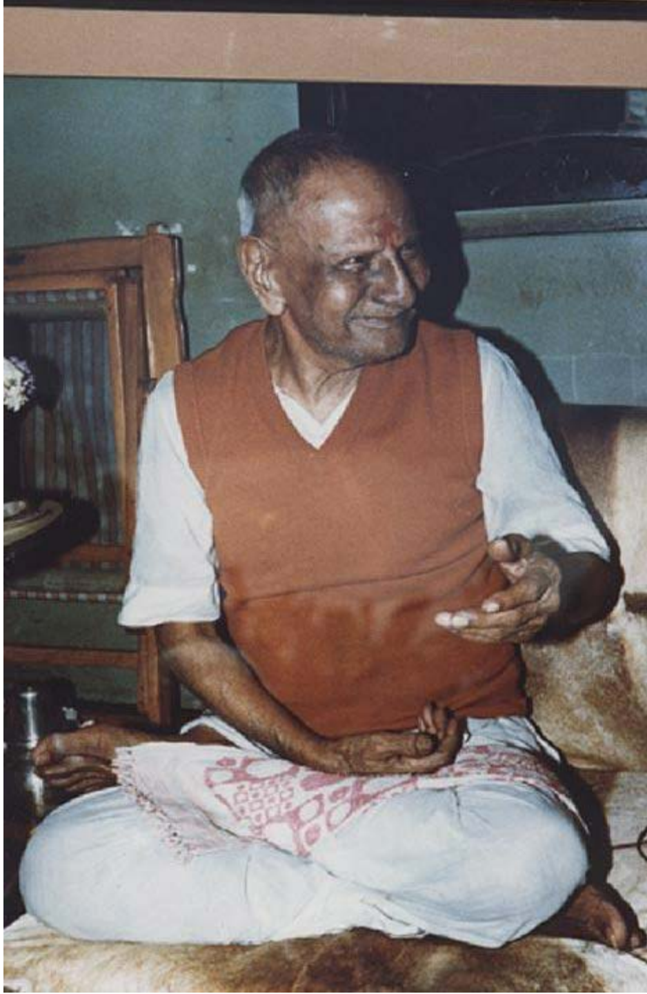
श्री निसर्गदत्त महाराज